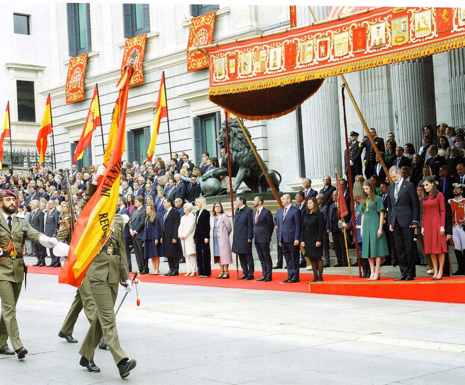
Sus Majestades los Reyes acompañados por la Princesa de Asturias durante el desfile militar - Congreso de los Diputados. Madrid, 29.11.2023

sin embargo, no ocultaban su convicción de que habría una restauración monárquica tras agotarse el régimen.